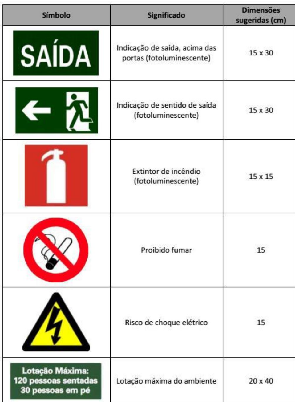
Tabela 1: Modelos básicos de sinalização